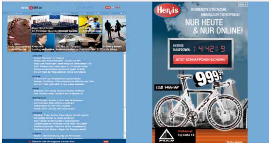
Kreativ im WWW: Ein Live-Ticker wie in der Hervis-Werbung oben würde in Zeitungen nicht funktionieren.

bürgerte sich ein, dass Onlineangebote vorwiegend gratis zur Verfügung gestellt werden. Egal wie man heute über die „Gratis-Mentalität“ denken mag, die Onlineservices mussten sich trotzdem irgendwie finanzieren und wollten natürlich auch Geld mit ihrer Arbeit verdienen. So kam es, dass das Internet quasi von Beginn an von Onlinewerbung begleitet wurde. Von da an – und das für lange Zeit – waren das hauptsächlich statische Werbebanner oberhalb oder neben den eigentlichen Websites. Mit neu entwickelten Technologien – ein Großteil heutiger Werbebanner basiert auf Adobe Flash – kam nach anfänglicher Eintönigkeit aber schnell Farbe ins Spiel. Auch abseits von fix platzierten Bannern, die eher Anzeigen aus Magazinen und Zeitungen ähneln, tat sich einiges. So hat man heute schier unendlich viele Möglichkeiten der Onlinewerbung zur Verfügung. Ein paar Beispiele sind Werbebanner, die gleichzeitig ein interaktives Spiel sind, großflächige Werbebanner, die hinter der eigentlichen Website zu liegen scheinen und vollständig zum Vorschein kommen, wenn man diese „wegblättert“, auch