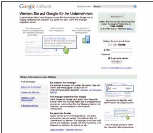
Google AdWords versucht Nutzer auf Seiten zu bringen, die mit ihren Interessen übereinstimmen.

normalen Ergebnissen werden diese aber in einer Spalte rechts neben den unkommerziellen Ergebnissen gezeigt. Die Reihung dieser Ergebnisse wiederum wird durch den Preis bestimmt, den man bereit ist pro Klick zu bezahlen.